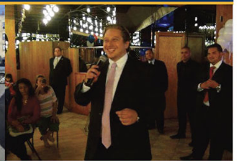
Fiesta gratuita de Navidad