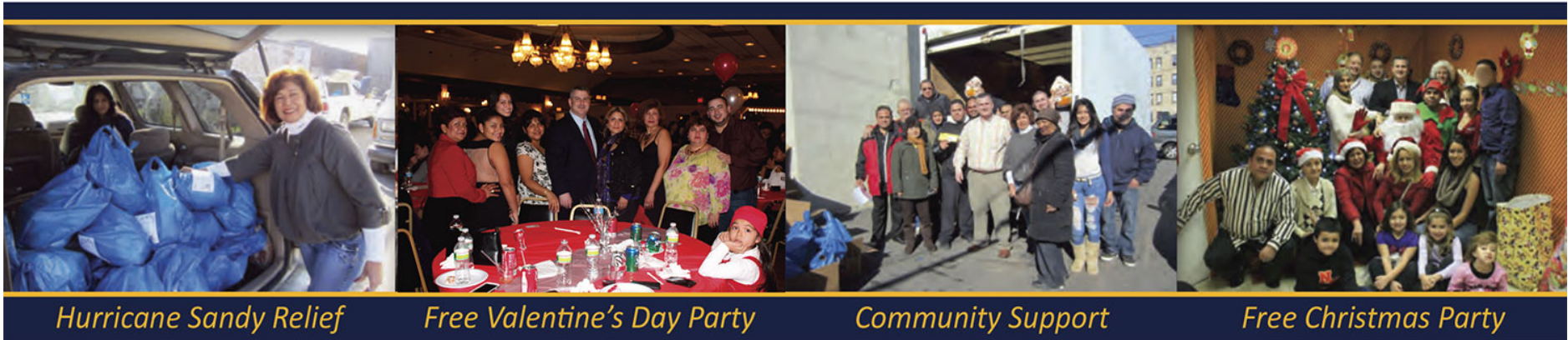
Hurricane Sandy Relief